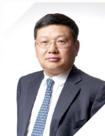
长江商学院创办院长 中国商业与全球化教授 项兵

希望我们培养的企业家学员们，在考虑商业决策的时候，也会考虑人类未来真正的长远利益，从而由富足的生活走向丰盈的人生，为中国乃至全球的经济、社会、环境的可持续发展和包容性增长贡献长江人的一份力量。构建责任共识！