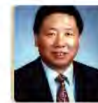
叶小文 中国社会主义学院党组书记、第一副院长

现任北京大学哲学系教授、博士生导师。主要研究领域是中国哲学史、儒学、道家与道教，近年来主要着力于宋明哲学及魏晋哲学的研究。迄今已出版专著三部：《郭象〈庄子注〉研究》（北京大学出版社，2010年）、《气本与神化：张载哲学述论》（北京大学出版社，2008年）和《匿名的拼接：内丹观念下道教长生技术的开展》（北京大学出版社，2002年），译著五部：《王弼〈老子注〉研究》、《近代中国之种族观念》、《宋代思想史论》、《章学诚的生平与思想》、《帝国的话语政治》等，发表学术论文四十余篇。2010年被评为“北京大学十佳教师”。