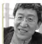
周海宏 中央音乐学院教授

曾任教于纽约州立大学、耶鲁大学、佩斯大学、台湾大学、新竹清华大学，现为香港城市大学中国文化中心教授兼主任。著作甚多，所涉学术范围甚广，以明清文化史、艺术思维及文化美学为主。编著有《汤显祖与晚明文化》、《茶饮天地宽 茶文化与茶具的审美境界》、《茶与中国文化 茶文化、茶科学、茶产业》、《口传心授与文化遗产 - 非物质文化遗产：文献、现状与讨论》、《陶瓷下西洋研究索引：十二至十五世纪中国陶瓷与中外贸易》及《在纽约看电影：电影与中国文化变迁》、《高尚的快乐》、《游于艺：跨文化美食》等三十余种。