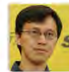
杨立华 北京大学教授

王尧先生，1928年生，江苏涟水人，著名藏学家。先后就读于南京大学中文系、中央民族学院民族语文系藏语专业。现为中央民族大学藏学研究院名誉院长、博士生导师，中国敦煌吐鲁番学会少数民族语言文字专业委员会主任委员，中国文化书院导师，中央文史馆馆员。代表著作有《敦煌本吐蕃历史文书》（北京：民族出版社，1992年）、《吐蕃金石录》（北京：文物出版社，1982年）、《吐蕃简牍综录》（北京：文物出版社，1986年）、《西藏文史考信集》（高雄：佛光出版社，1992年）、《水晶宝鬘——藏学文史论集》（台北：佛光文化事业有限公司，2000年）、《藏学零墨》（高雄：佛光出版社，1992年）等。