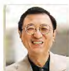
郑培凯 香港城市大学教授

曾任教于纽约州立大学、耶鲁大学、佩斯大学、台湾大学、新竹清华大学，现为香港城市大学中国文化中心教授兼主任。著作甚多，所涉学术范围甚广，以明清文化史、艺术思维及文化美学为主。编著有《汤显祖与晚明文化》、《茶饮天地宽 茶文化与茶具的审美境界》、《茶与中国文化 茶文化、茶科学、茶产业》、《口传心授与文化遗产 - 非物质文化遗产：文献、现状与讨论》、《陶瓷下西洋研究索引：十二至十五世纪中国陶瓷与中外贸易》及《在纽约看电影：电影与中国文化变迁》、《高尚的快乐》、《游于艺：跨文化美食》等三十余种。