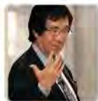
杜维明 长江商学院名誉教授

历任中国文化学院哲学系教授、美国加州大学柏克莱校区研究员、北京大学哲学系教授以及国立台湾大学哲学系教授等职，并担任《道家文化研究》主编。陈鼓应先生近二三十年来致力于道家思想研究，主要著作有：《悲剧哲学家尼采》、《尼采新论》、《庄子哲学》、《老子注译及评介》、《庄子今注今译》、《〈黄帝内经〉今注今译—马王堆汉墓出土帛书》、《管子四篇诠释—稷下道家代表作》、《周易今注今译》（合著）、《老庄新论》、《易传与道家思想》、《道家易学建构》等。