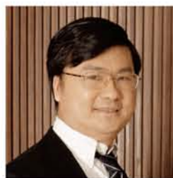
周春生 博士，普林斯顿大学

长江商学院经济学及人力资源学教授、副院长，明尼苏达大学卡尔森管理学院终身教授，美国密歇根大学戴维逊研究所研究员。1989年后曾兼职担任世界银行顾问，清华大学经济管理学院中国经济研究所高级研究员，中国留美经济学会副会长。研究兴趣主要集中在组织理论、劳动经济学与人力资源管理、中国经济、货币与公共金融等。在过去几年中，他在国际著名期刊发表多篇论文，并被大量引用。