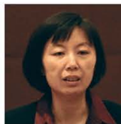
周京 博士，伊利诺伊大学厄巴纳香槟分校

长江商学院金融学教授、长江EMBA及高层管理教育学术主任。曾任北京大学光华管理学院院长助理，高层管理者培训与发展中心主任，金融学教授、博士生导师、香港大学荣誉教授、香港城市大学客座教授。周春生教授在金融学研究方面很有建树，他提出的信用风险分析模型，股票定价及公司分拆的实证研究，行为金融学理论引起国际学术界及金融行业的广泛关注。有关信用风险所作的开创性工作得到了巴塞尔委员会的高度重视，并被其录入了官方文件，对国际金融规范的制定产生了积极的影响，相关论著已被美国及欧洲多家咨询机构及投资银行列为风险管理培训的教材。因出色的研究，周春生教授多次获奖，1994-1995年获得普林斯顿大学优秀博士生荣誉奖学金Harold Dodds奖，2002年获得第九届全球金融年会最佳论文奖，2003年获得国际杰出青年基金。