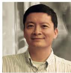
王一江 博士，哈佛大学

长江商学院金融学兼职教授，中国工商联并购工会主席以及万盟并购集团创始人。王巍教授曾任中国南方证券有限公司执行副总裁（1992年-1996年）、万盟并购管理控股公司主席（1997年-2006年）。他在公司理财、并购和IPO运作领域具有丰富的经验。在国内和海外市场，作为上市推荐人，王教授已引导并监督了40余家中国公司成功上市。他曾任中国众多一流公司的金融顾问，为其解答关于重组、金融、并购和IPO等方面的问题。王巍教授还出任三家上市公司的独立董事并担当中国多个部级、省级政府的经济顾问，同时具有不同国际公司的工作经验，包括东京的Nomura Security、华盛顿的世界银行以及纽约的化学银行。王巍教授在众多的学术和商业期刊发表超过百篇评论与论文，曾作为图书“Chinese Way (2000)”作者获得管理层融资收购图书的国家图书奖，2001年至2007年担任中国并购年鉴的主笔和编辑。