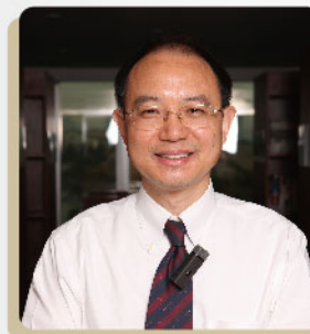
欧阳辉 长江商学院教授

长江商学院战略学副教授，长江跨国公司研究中心主任。滕斌圣教授 1998 年在纽约市立大学获战略学博士学位，1998—2006 年执教于美国乔治华盛顿大学商学院，曾任战略学副教授、博导，享有终身教职，并负责该校战略学领域的博士项目。滕斌圣教授的研究与教学领域集中在战略联盟、收购与兼并、创业与创新、家族企业管理以及企业的跨国经营。滕斌圣教授在国际著名学刊上发表了二十多篇论文，其中包括《管理学会评论》、《组织科学》等顶尖刊物。他被认为是战略联盟方面的权威，受到《华尔街时报》、《华盛顿邮报》等主流媒体的多次专访，研究成果被众多战略学教材引用。